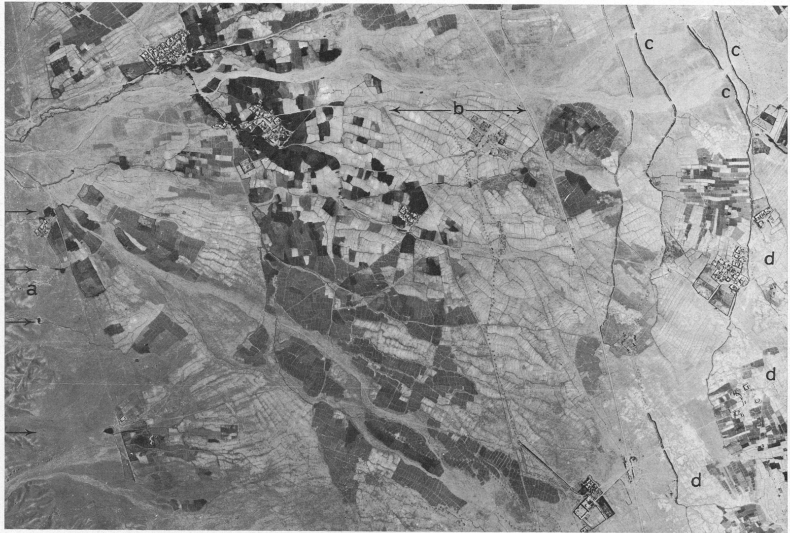
Luftbild: Landschaft mit Bewässerung aus Karezen bei Nani, etwa 20 km südlich von Ghazni, Maßstab etwa 1:30 000.

In diesem Luftbild werden mehrere typische Erscheinungen um die Bewässerung aus Karezen deutlich: Bei einigen Austrittsstellen des Grundwassers sind Stauteiche eingerichtet (a). In den Feldfluren sind voll- und (b) teilbewässerte Flächen (geerntetes Getreide) voneinander abgesetzt. Im Gelände mit kaum merklichem Gefälle werden sehr lange offene Kanalstrecken notwendig (c). In der Oase ist ein weiterer Grundwasserhorizont von Karezen erfaßt. Im tiefsten und ebenen Teil herrscht ungenügender Abfluß, so daß Salze und Gipse auf dem Boden ausblühen (d).