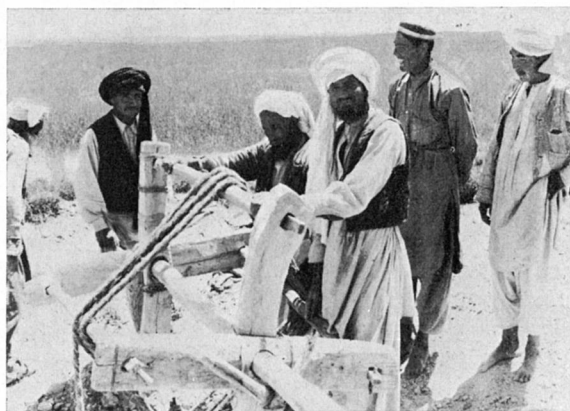
Bild 1: Reinigungsarbeiten an einem Karez in der Ebene südlich von Ghazni

Je nach Länge der Untertagestrecke dauert es all-