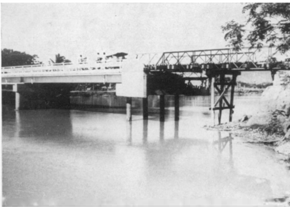
Photo 2: An den größeren Flüssen in der Ebene von Zentral-Luzon sind einige Brücken durch Lateralerosion von den Ufern abgetrennt worden. Hier im Deltabereich des Agno-River bei dem Ort Lingayen.

Neben dieser insgesamt geringen, lokal jedoch – wie genannt – teilweise beträchtlichen Sedimentation tritt im Bereich der Ebene ebenfalls Erosion auf. Diese ist jedoch unmittelbar an die Flußbetten gebunden. Vielfach tritt an den Ufern der Flüsse in der Ebene Erosion infolge Uferunterscheidung auf. Brücken werden durch seitliche Unterschneidung von der Verbindung zum Ufer abgetrennt. Dies konnte mehrfach beobachtet werden, z. B. am Bued-River südwestlich Rosario, im Agno-Delta bei Lingayen etc. Diese Erosionsvorgänge in unmittelbarer Nähe der Flüsse sind in ihrer Häufigkeit sicherlich während dieser Flut gesteigert gewesen gegenüber anderen Hochwassern geringeren Ausmaßes (Photo 2).