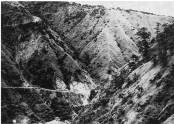
Photo 1: Häufig werden Hangrutschungen durch den Straßenbau ausgelöst. Jedoch sind die schütterere Vegetation und steile Hänge zusätzlich die Erosion verstärkende Faktoren. Aufforstungen, wie man sie an einigen Hängen beobachten kann, sollen die Hänge zukünftig stabilisieren. Agno-River-Einzugsgebiet südlich der Ambuklao-Talsperren.

gebiet) und des Agno-River (östlich Baguio-City) an gestellt werden. Sichtbarste Erosionsform sind besonders im Agno-River-Gebiet zahlreiche Hangrutschungen. Häufig treten diese unmittelbar an Straßenanschnitten auf. Andererseits zeigen einige, die an Hängen unabhängig vom Straßenverlauf entstanden sind, daß die Anlage der Straßen zwar in vielen Fällen das Entstehen einer Hangrutschung fördern kann, dies aber nicht die alleinige Voraussetzung ist. Hangrutschungen treten dort auf, wo ein steiler Hang mit schütterer Vegetationsbedeckung vorhanden ist. Diese Tatsache im Zusammenhang mit dem rasch und tiefgründig verwitternden Substrat, bei dem ein hoher Anteil an Ton bereitgestellt wird, der bei starker Durchfeuchtung fließfähig wird, dominiert (s. I. 4). Sehr aktiv waren außerdem Erosionsvorgänge, die an Abraumhalden und nicht ausreichend befestigten Wegbauten im Zusammenhang mit Bergbau-Aktivitäten entstanden waren. Hier ist sicherlich eine große zukünftige Aufgabe, diese Erosionsschäden zu vermindern. Die Erosionsschäden, die im Zusammenhang mit Holzeinschlag entstehen, konnten in dem begangenen Areal nur zum Teil beobachtet werden. Eine eingehende Bewertung dieser Vorgänge ergibt sich aus dem oben zitierten Report (4) (Photo 1).