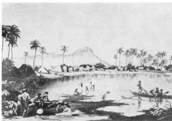
Photo 1: Waikiki um 1810 aus Beständen des Bishop Museum, Honolulu Waikiki in 1810 from the Bishop Museum's holdings, Honolulu

Der Fremdenverkehr ist heute der wichtigste Wirtschaftszweig, die größte Einnahmequelle Hawaiis. Von einer Gesamtsumme von 3.786 Mio $ kamen im Jahre