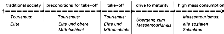
Abb. 2: Stadien des Industrialisierungsprozesses (nach W. W. Rostow) und Teilnehmerschaft am endogenen Tourismus Stages in the industrialization process (after W. W. Rostow) and participation in endogenous tourism

Räume und kleineren städtischen Siedlungen als Quellgebiete des Tourismus so gut wie ausscheiden.