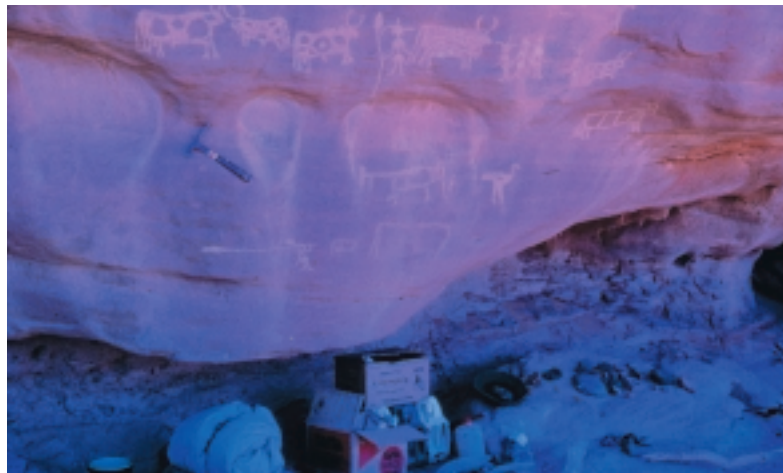
Photo 2: Nur in den Gebirgen und Bergländern bestand für die Rinderhirten die Möglichkeit, auf Felswänden der Nachwelt Botschaften vom damaligen Leben zu hinterlassen. Die Abbildungen zeigen – bei gleichartigen Motiven – wechselnde Stilrichtungen, von denen bisher nicht ganz klar ist, ob diese auf individualistischen, regionalen oder chronologischen Unterschieden beruhen. Hier bei Gabrong am Enneri Dirennao/Tibesti, wurde zum Beispiel Wert auf die Kennzeichnung der Rinder als Paarhufer gelegt. Die Menschendarstellungen mit „Antennen“ werden allgemein in späte Perioden eingeordnet. Hammer als Größenmaßstab

Masterly depictions of wild and domesticated animals may be found everywhere in the Sahara on rock walls and under abris, some painted in colours, others scratched, gouged out, or cut into the rock. Here, at the solitary rocks of Terarart, c. 50 km S of Djanet (Algeria), the artist, who lived thousands of years ago, fixed cattle at the watering hole almost in the manner of a relief. This type of life-size naturalistic presentation characterizes as the earliest level of rock pictures in the Sahara, the Bubalus or hunter period