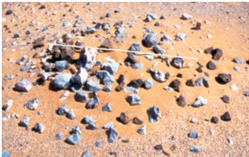
Photo 4: Ein Steinplatz bei Djara in der Westwüste Ägyptens (vgl. GABRIEL 2002, Fig. 3), bei dem die unregelmäßige Ansammlung von etwa faustgroßen Steinen unterschiedlicher Petrographie leicht von Flugsand überdeckt ist. Die Steinplätze enthalten meist Brandreste (Asche, Holzkohle, Feuerspuren) und sind als Feuerstellen zu interpretieren, an denen die Nahrungszubereitung ohne Keramik vonstatten ging. Maßstab: 1 m

Everywhere in the plains of the Central Sahara camp-site relics of Neolithic herding nomads may be found among the loose debris on the ground; they are recognized by small accumulations of stone (“stone sites”) and scattered artefacts. Entire fields of stone sites, the carbon dating of which spans the Neolithic millennia, prove their return to the same favoured sites, i. e. the waterholes. This photograph was taken between Wau el Kabir and Wau en Namus in the Fezzan