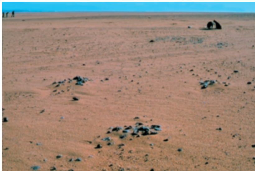
Photo 6: Ein Steinplatzfeld im Tidikelt (zwischen Aoulef und In Salah, Südalgerien), bei dem mit ca. 8.500 B.P. recht hohe Radiokarbonaten ermittelt wurden (GABRIEL 1984b, 101). Das deutet darauf hin, dass die zentralsaharischen Gebirgsregionen wohl insgesamt als Quellgebiete für die kulturelle Expansion nach der endpleistozänen Trockenphase infrage kommen, nicht nur die östlicheren Teile

Typical artefacts accompanying stone sites are rough stone blocks of this kind, with deliberately inserted notches on the long edges. It may be assumed that herd cattle (milking cows?) were tethered to these stones with ropes, so that they were able to move, but not too far from the camp site. These are two examples from the Wadi Prendergast (north west Sudan)