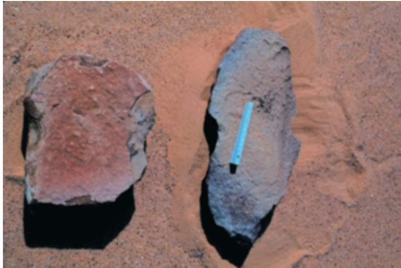
Photo 5: Typische Begleitartefakte an Steinplätzen sind derartige grobe Steinblöcke, die durch gezielte Schläge an den Längskanten Kerben aufweisen. An solchen „Fesselsteinen“ wurden vermutlich Herdentiere (Milchkühe?) mit Stricken angebunden, damit sie sich zwar noch bewegen, aber nicht zu weit vom Lagerplatz entfernen konnten. Hier zwei Exemplare aus dem Wadi Prendergast (Nordwest-Sudan)