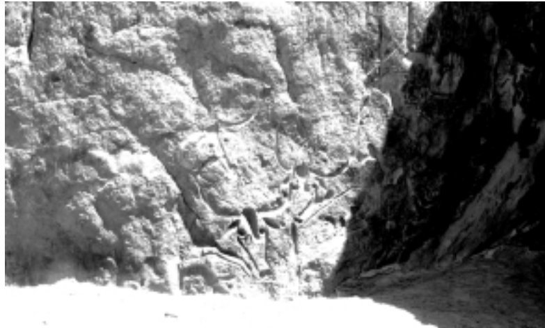
Photo 1: Meisterhafte Abbildungen von Wild- und Haustieren finden sich an den Felswänden und unter Abris allenthalben in der Sahara, teils farbig gemalt, teils geritzt, gepunzt oder eingeschliffen. Hier, bei den einsamen Felsen von Terarart ca. 50 km südlich von Djanet (Algerien), wurden die Rinder vor Jahrtausenden durch den Künstler fast reliefartig an der Tränke fixiert. Eine derartige, naturalistische Darstellung in Lebensgröße kennzeichnet eigentlich die älteste Stufe der Felsbilder in der Sahara, die Bubalus- oder Jägerperiode